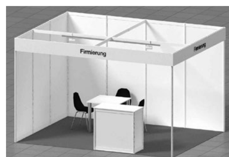
Beispiel-Bild eines Eckstandes