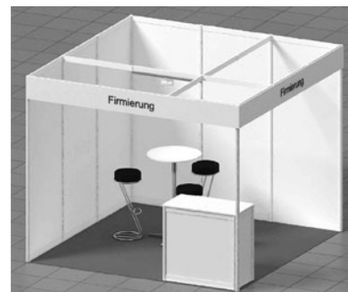
Beispiel-Bild eines Eckstandes